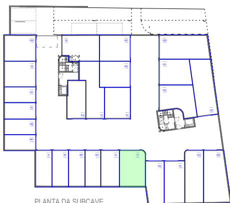
PLANTA DA SUBCAVE DISPOSIÇÃO EM PLANTA SEM ESCALA