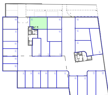
PLANTA DA SUBCAVE DISPOSIÇÃO EM PLANTA SEM ESCALA